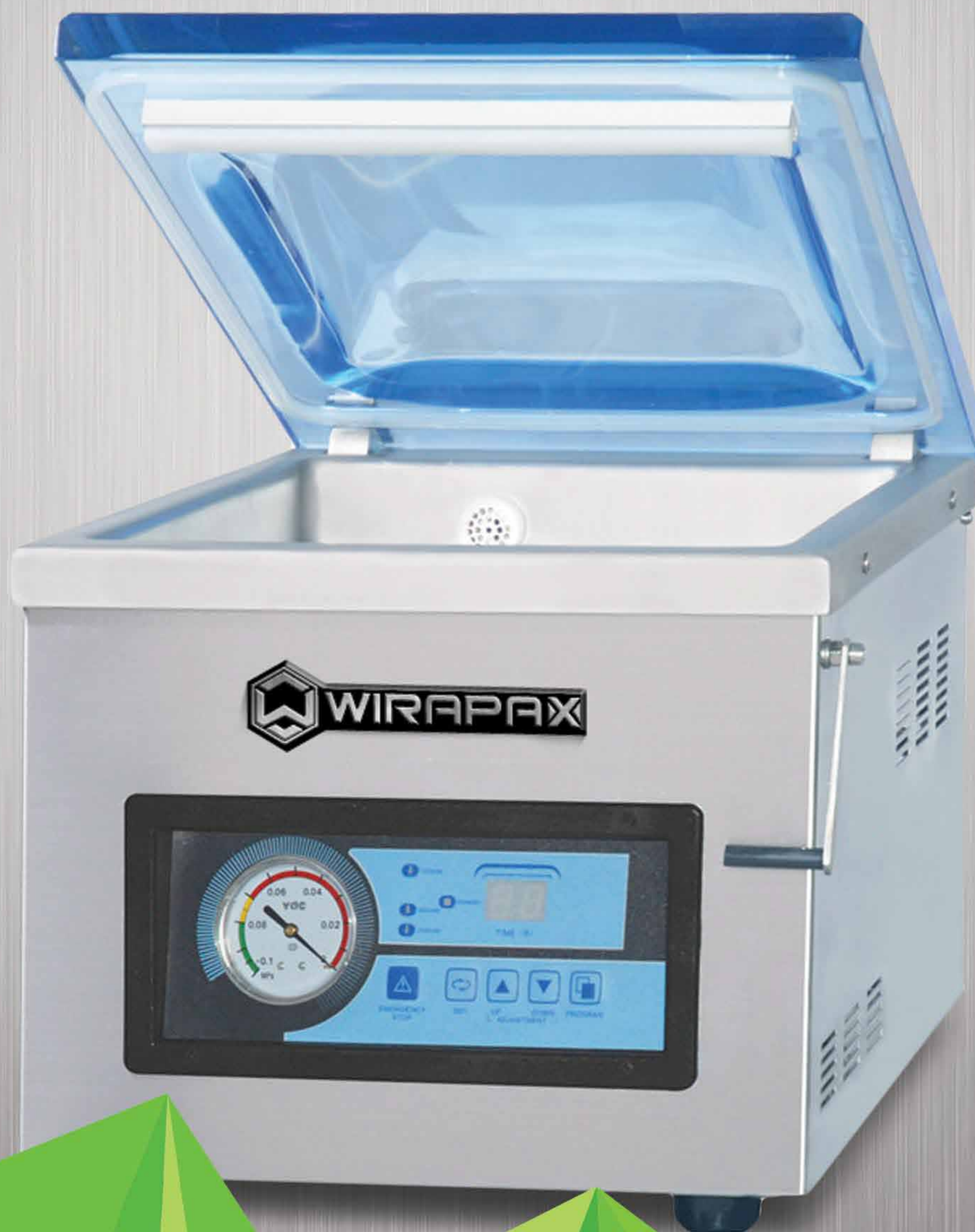
TABLE STYLE VACUUM MACHINE HVC-260T