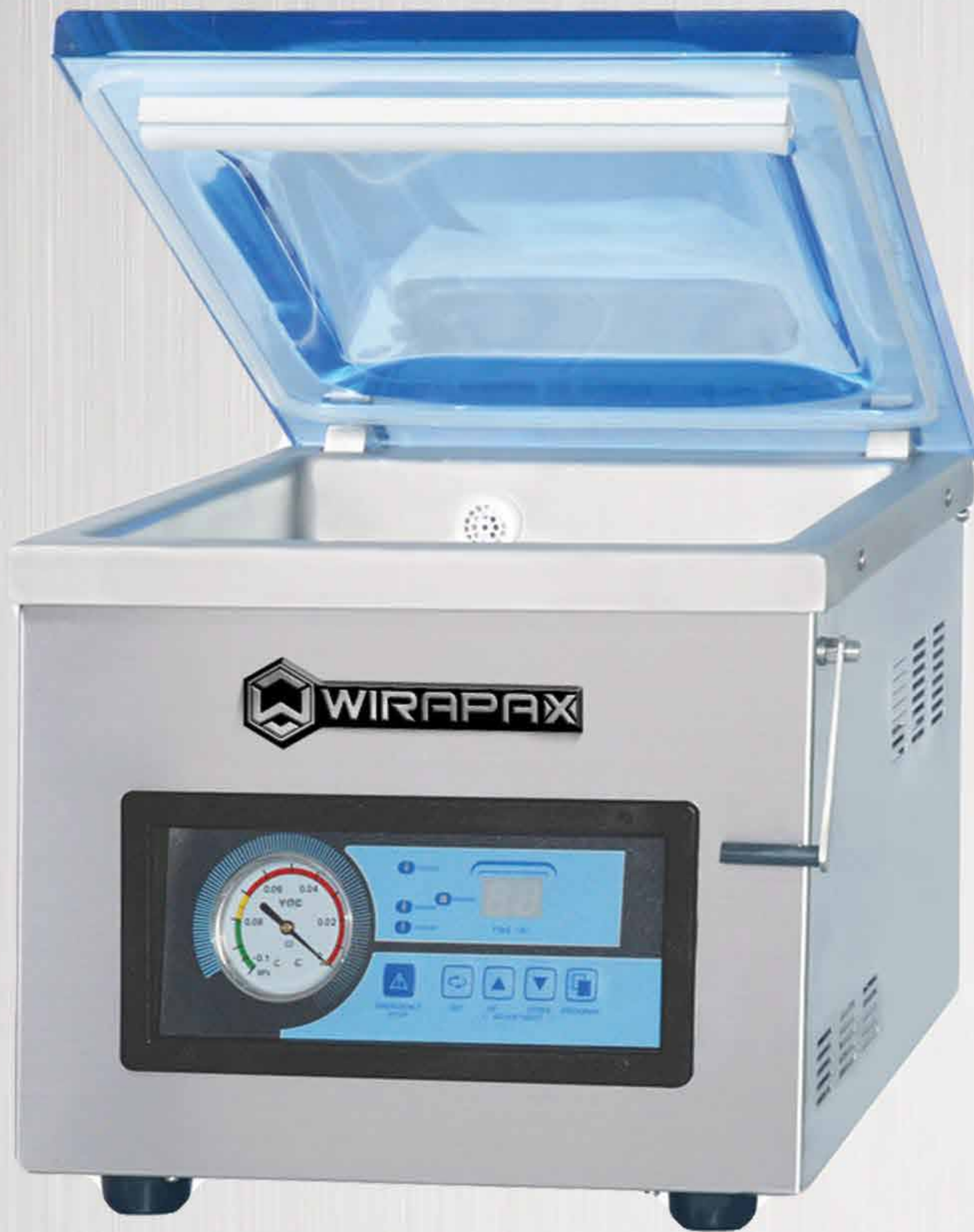
TABLE STYLE VACUUM MACHINE